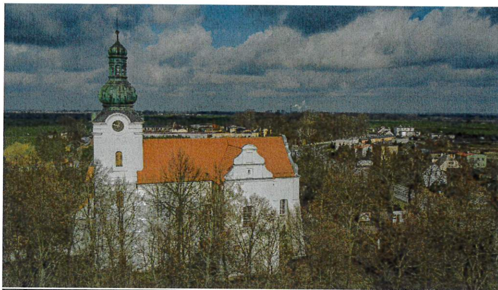
Sanktuarium Matki Bożej Królowej Miłości i Pokoju, Pani Kujaw w Markowicach (fot.: Archiwum Starostwa Powiatowego w Mogilnie)