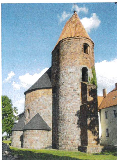
Rotunda św. Prokopa w Strzelnie

Budzi podziw od wieków, stanowiąca najcenniejsze dobro kultury powiatu. Rotunda w Strzelnie to jedna z najstarszych i największych świątyń romańskich w formie rotundy w Polsce, pochodząca jeszcze z XII wieku. Do 1779 roku rotunda w Strzelnie nosiła wezwanie Św. Krzyża, w czasie wojen napoleońskich, w XIX wieku służyła jako spichlerz, następnie jako dzwonnica. Podczas II wojny światowej Niemcy urządzili w rotundzie magazyn, a wycofując się podłożyli materiały wybuchowe, ale mury świątyni wytrzymały, zniszczeniu uległa tylko kopuła i górne partie wieży.