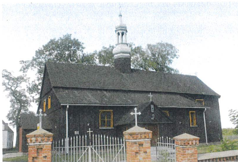
Kościół par. p.w. św. Michała Archanioła w Niestronnie

Obecny kościół ufundowała Kapituła gnieźnieńska w 1742 roku. W 1868 roku został gruntownie odnowiony. Jest to świątynia drewniana, konstrukcji zrębowej , orientowana. Posiada zamknięte trójbocznie prezbiterium. Szersza nawa pierwotnie zbliżona była do kwadratu, obecnie jest to plan wydłużonego prostokąta. Kościół nakryty został dachem siodłowym. Wnętrze kryje strop płaski, wydzielony profilowaną listwą. Nad wschodnią częścią dachu nawy znajduje się wieżyczka na sygnaturkę powstała w okresie późniejszym. Do zabytków należą: ołtarz główny z ok. 1630 roku, dwa ołtarze boczne pochodzące z 1. połowy XVIII wieku oraz XIX-wieczna kopia obrazu Rafaela „Madonna Sykstyńska”.