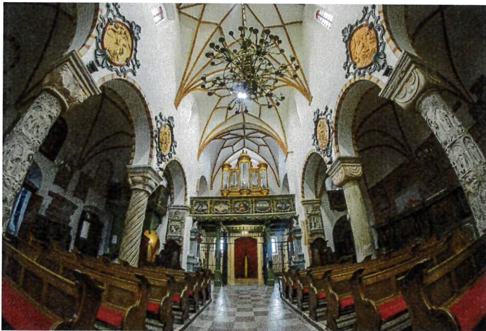
Bazylika p.w. Św. Trójcy w Strzelnie

Nawę główną od naw bocznych oddzielają cztery słynne kolumny romańskie z końca XII w., wykute w piaskowcu, później zamurowane i odkryte w 1946 r. Pierwsza z prawej jest spiralnie żłobkowana, pierwsza z lewej, niegdyś polichromowana, jest gładka. Bogato zdobiona jest druga para kolumn, na każdej z nich znajduje się 18 postaci. W ścianach prezbiterium znajdują się dalsze, częściowo odświeżone, romańskie kolumny o gładkich trzonach. Umieszczone po wschodniej stronie kościoła, których trzony wypełnione są dekoracjami figuralnymi zachwycają wyobrażeniem pojęć moralnych jak Sprawiedliwość, Mądrość, Gniew, Roztropność i wiele innych.