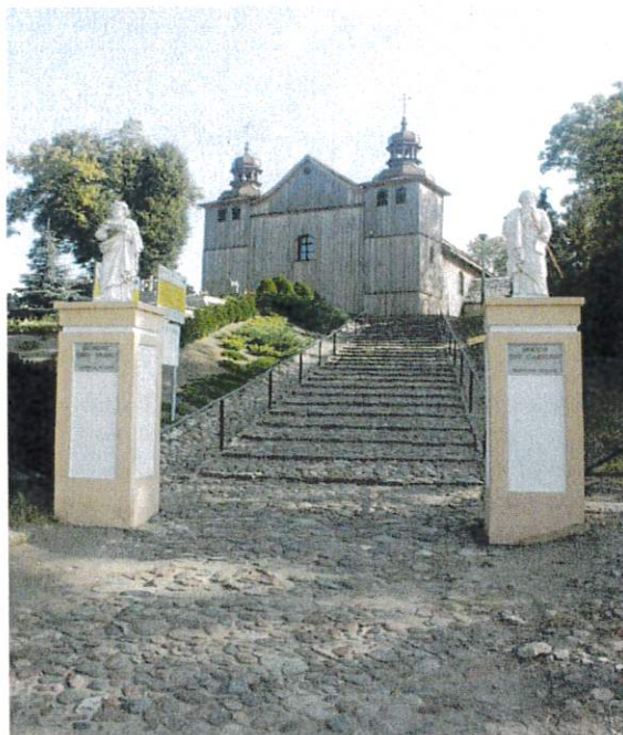
Kościół par. p.w. Św. Ap. Piotra i Pawła w Wylatowie