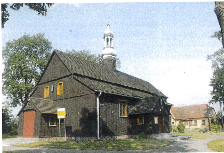
Kościół par. p.w. św. Michała Archanioła w Siedlimowie

XVIII wieku, klasycystyczne tabernakulum z rzeźbą Baranka Eucharystycznego. Pozostałe późnobarokowe wyposażenie pochodzi z końca XVIII wieku.