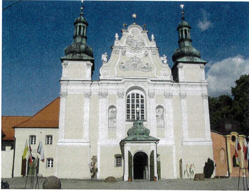
Bazylika p.w. Św. Trójcy w Strzelnie

Nawę główną od naw bocznych oddzielają cztery słynne kolumny romańskie z końca XII w., wykute w piaskowcu, później zamurowane i odkryte w 1946 r. Pierwsza z prawej jest spiralnie żłobkowana, pierwsza z lewej, niegdyś polichromowana, jest gładka. Bogato zdobiona jest druga para kolumn, na każdej z nich znajduje się 18 postaci. W ścianach prezbiterium znajdują się dalsze, częściowo odświeżone, romańskie kolumny o gładkich trzonach. Umieszczone po wschodniej stronie kościoła, których trzony wypełnione są dekoracjami figuralnymi zachwycają wyobrażeniem pojęć moralnych jak Sprawiedliwość, Mądrość, Gniew, Roztropność i wiele innych.