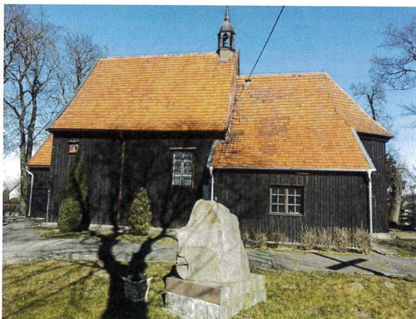
Kościół par. p.w. Narodzenia Najświętszej Maryi Panny w Strzelcach

Pierwsza wzmianka o wsi pochodzi z 1065 roku w falsyfikacie mogileńskim jako własność klasztoru benedyktynów w Mogilnie. Parafia powstała prawdopodobnie wraz z lokacją wsi na przełomie w XIII i XIV wieku i w tym czasie został też wybudowany pierwszy kościół, który spłonął. Obecną świątynię wzniesiono w pierwszej połowie XVII wieku. Budynek o konstrukcji zrębowej , obiekt drewniany, jednonawowy, wielokrotnie odnawiany i przebudowywany, co spowodowało zatarcie jego starych cech stylowych. Kruchtę budynku odbudowano w konstrukcji szkieletowej. Wnętrze kościoła zdobią rokokowe ołtarze: główny z obrazem Matki Bożej z Dzieciątkiem i boczny oraz XVIII-wieczny krucyfiks. Przy świątyni znajduje się drewniana dzwonnica, a także kapliczka i grotka maryjna.