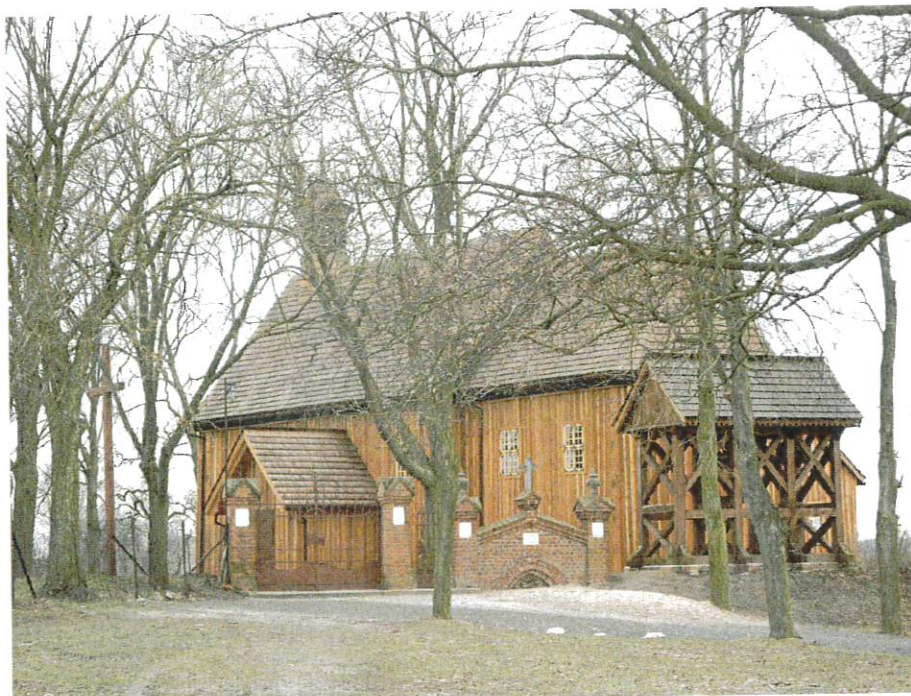
Kościół par. p.w. Św. Wawrzyńca w Parlinie