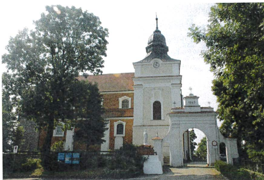
Klasztor Zakonu Braci Mniejszych Kapucynów w Mogilnie