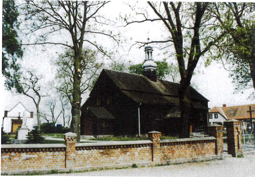
Kościół par. p.w. św. Anny w Kościeszkach